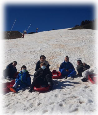
Luge à Font-Romeu