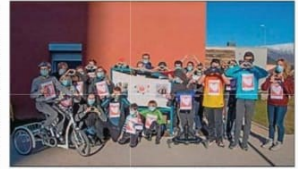
► Les jeunes de l'IME Les isards qui ont participé à la course solidaire.