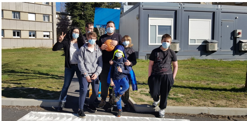
La Dream Team après le show