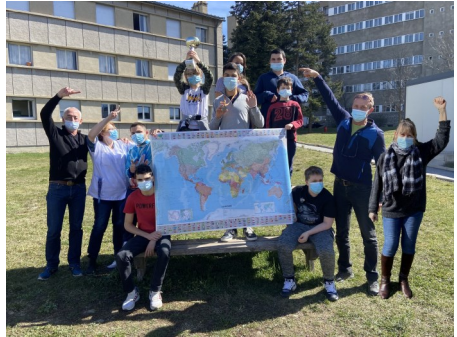
Tous les participants du Vendée Globes

la course du Vendée Globes. Après quelques semaines de navigation, certains ont abandonné tandis que d'autres n'ont rien lâché et se sont battus jusqu'au bout pour boucler