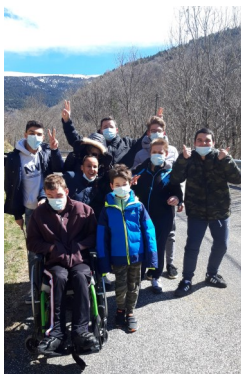
Balade en groupe