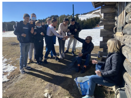
Pause goûter au soleil