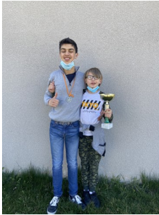
Nos deux vainqueurs très fiers

Comme vous le savez, au mois de décembre 2020, une grande partie du groupe avait pris le départ virtuel de la course du Vendée Globes. Après quelques semaines de navigation, certains ont abandonné tandis que d'autres n'ont rien lâché et se sont battus jusqu'au bout pour boucler