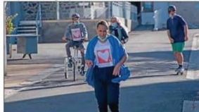
Il les 14 jeunes ont parcouru en cumulés, 75 km et récolté 150 € pour Initiatives-Cœur, soutenu par le skipper Sam Davies

► Participation à la course solidaire « Nous avons suivi Samantha car elle s'est lancée deux dé-