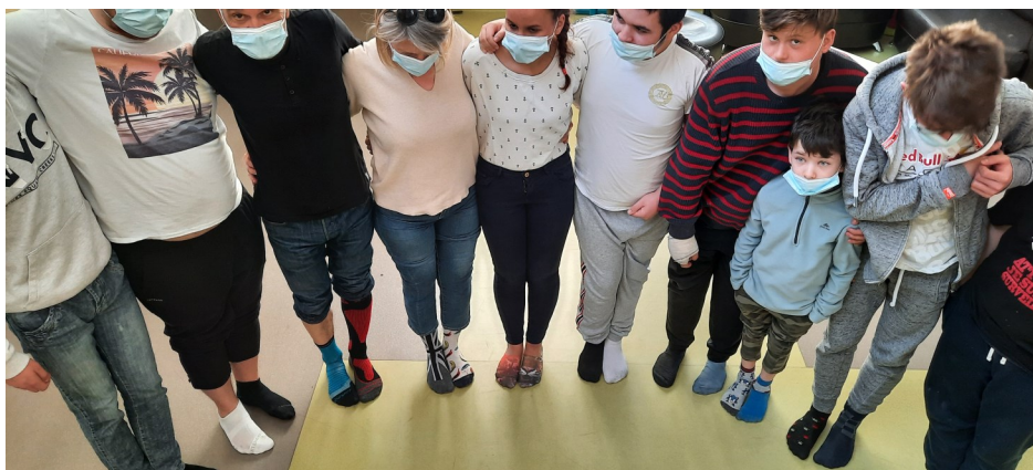
Le groupe des Isards toujours présent pour les bonnes causes.

Bien que ces personnes aient un chromosome supplémentaire, elles ne s'en vantent pas !